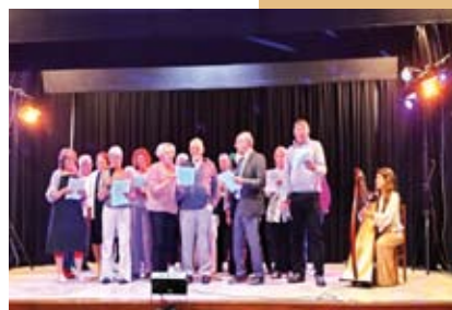
Jumelage - Page 12