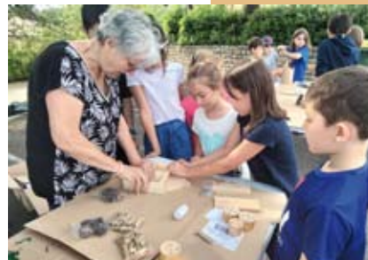
Le CMJ - Page 10