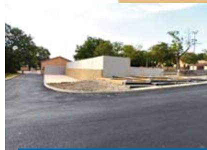
Aménagements - Page 9